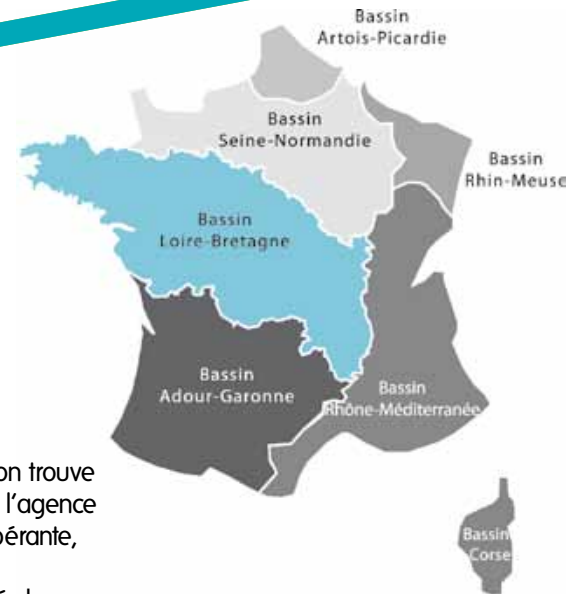
La France continentale est divisée depuis 1964 en bassins hydrographiques

La gestion française de l'eau permet d'associer les usagers et de prendre en compte la particularité de chaque bassin.